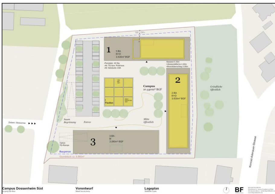
Abb. 1: Planungsziel „Campus“

Im gesamten Gewerbegebiet wurde in den textlichen Festsetzungen die offene Bauweise („o“) festgesetzt und nicht eine abweichende Bauweise („a“), wie sie in den Nutzungsschablonen der Planzeichnung steht. In den textlichen Festsetzungen findet sich demzufolge auch keine Definition der abweichenden Bauweise und auch in der Begründung wird sie nicht hergeleitet. Durch die vorliegende 1. Änderung des Bebauungsplanes werden die Nutzungsschablonen in der Planzeichnung an die textliche Festsetzung für das Gewerbegebiet angepasst. Gleichzeitig reagiert die Gemeinde auf den Wunsch der Grundstückseigentümer im eigenständigen „Ostquartier“, die dort für die Entwicklung eines „Campus“ eine abweichende Bauweise („a“) wünschen, um hier einrahmende Gebäude von mehr als die bei der offenen Bauweise („o“) zulässigen 50 m Länge errichten zu können.