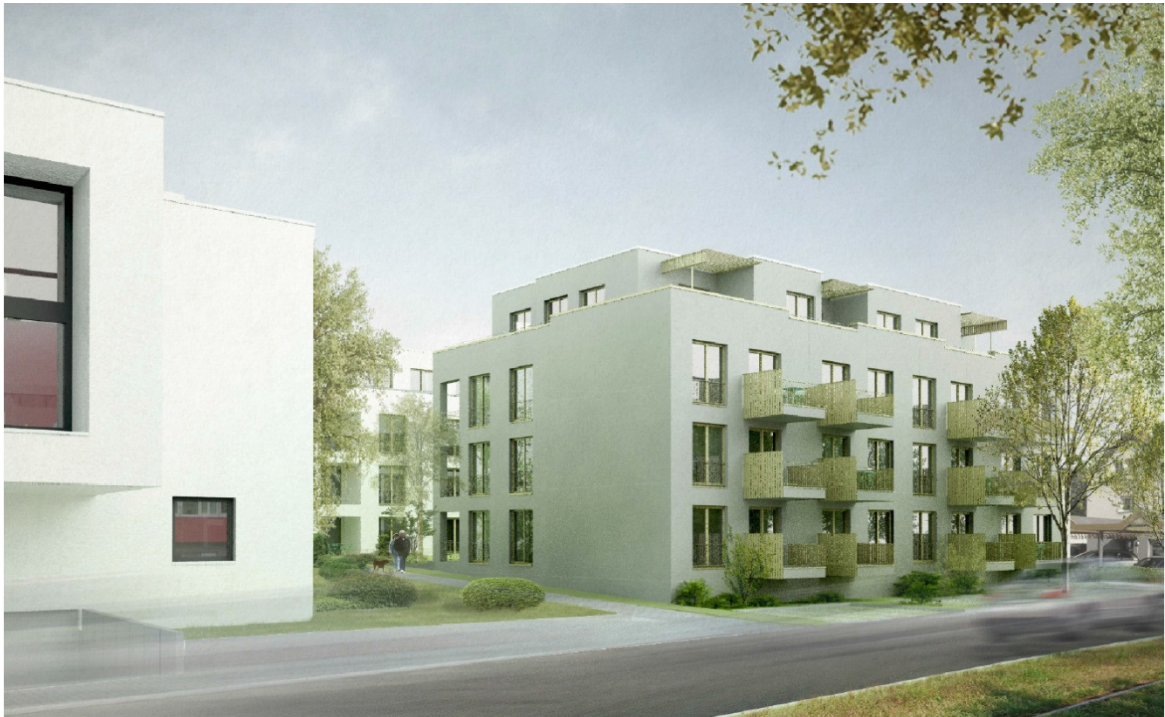
Visualisierung Ansicht Nordost (Entwurf Januar 2021) Quelle: Bilger-Fellmeth Architekten, Frankfurt