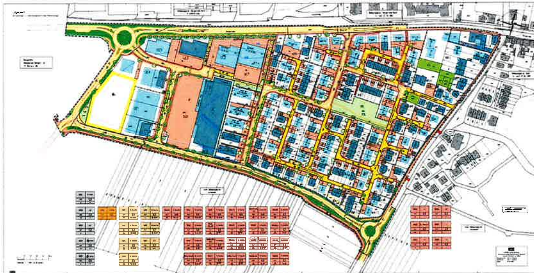
Bebauungsplan „Wohngebiet West II / Gewerbegebiet Nord, 3. Änderung“, 2008