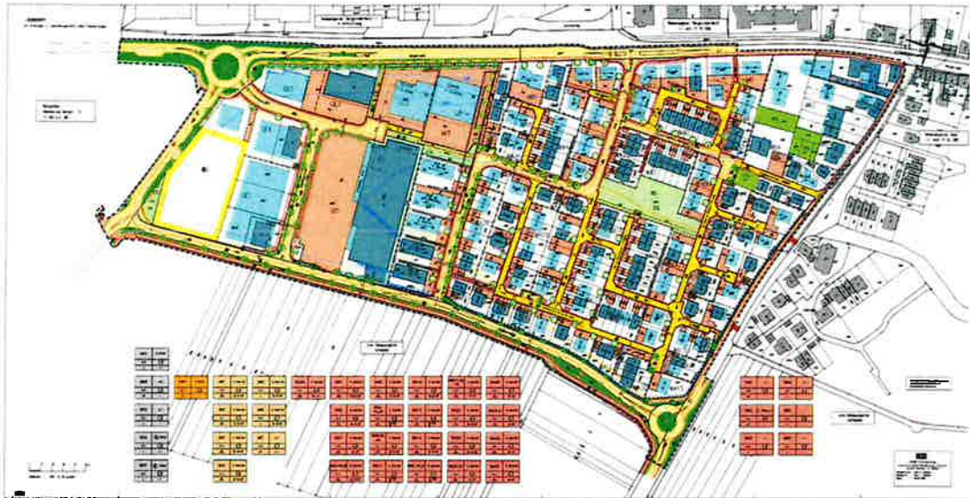
Bebauungsplan „Wohngebiet West II / Gewerbegebiet Nord, 3. Änderung“, 2008