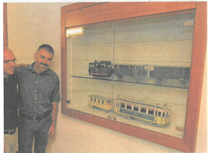
Auch detailgetreue Triebwagen der OEG sind im Rathaus zu sehen